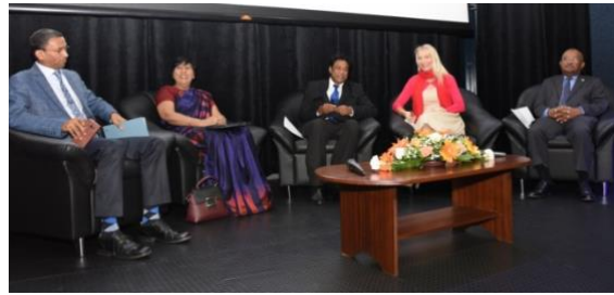
Table ronde de la COI sur la Sécurité Maritime